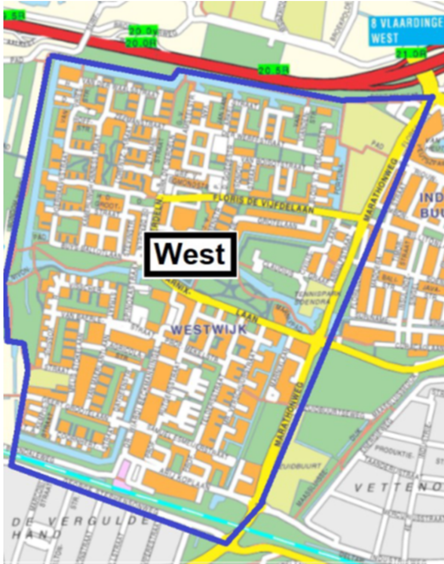
Veiligheidsrisicogebied Vlaardingen Holy